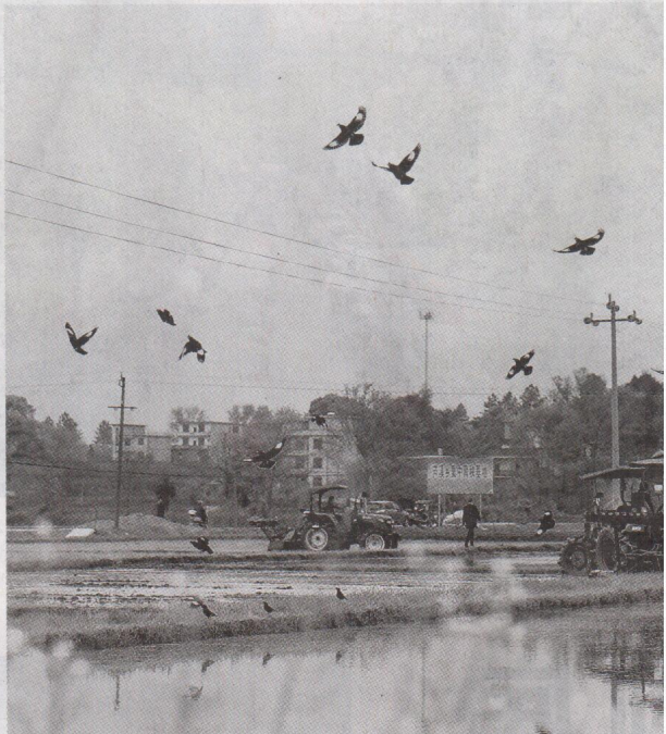
3月21日,永新县芦溪乡社园村早稻育秧基地,农户正驾驶农机翻耕稻田,抢抓农时备春耕。